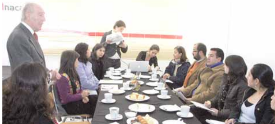
Primera reunión de coordinación de las Olimpiadas de Actualidad, realizada en Curicó.

Las Olimpiadas de Actualidad que este año cuenta con la co-