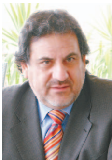
CARLOS CANTERO O. Senador

En materias de seguridad ciudadana, no puedo dejar de mencionar