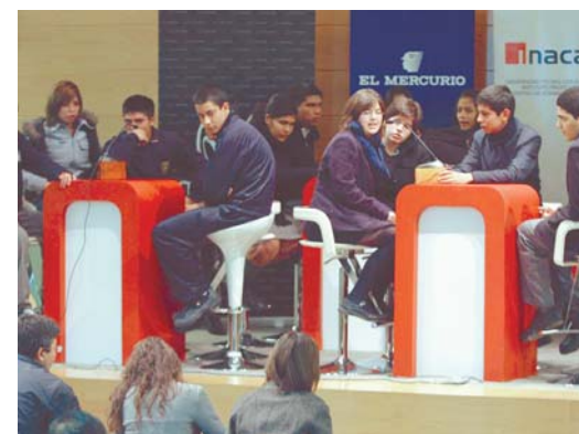
Alumnos en competencia.