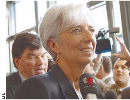
La ministra de Finanzas de Francia recibió ayer el respaldo oficial del presidente Sarkozy.

Fuentes en Francia aseguran que Lagarde ya contaría con el respaldo de China, pero ayer Beijing envió un comunicado señalando que quiere una competencia abierta. Brasil, que no presentará candidato propio, tampoco ha decidido respaldar al gobernador del banco central de México, Agustín