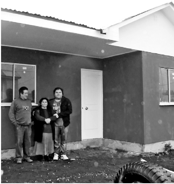
Serviu informó sus avances.

En Ñuble hay 89 viviendas en ejecución; 48 de ellas con un 75% de avance, mientras las 41 restantes presentan un avance cercano al 30%.