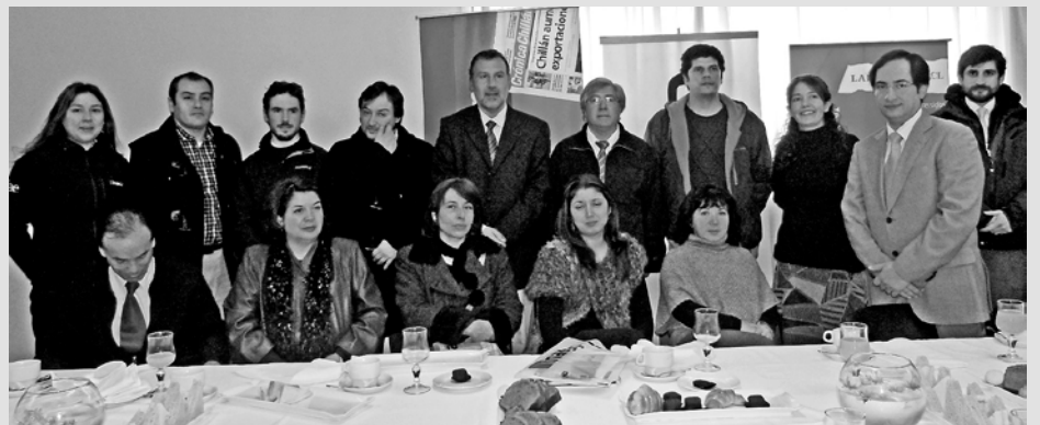
Ayer tuvieron un desayuno en la sede de Inacap.