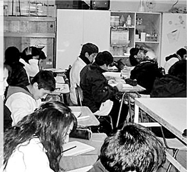
Alumnos de San Nicolás desarrollan innovador modelo que es catalogado de excelencia.