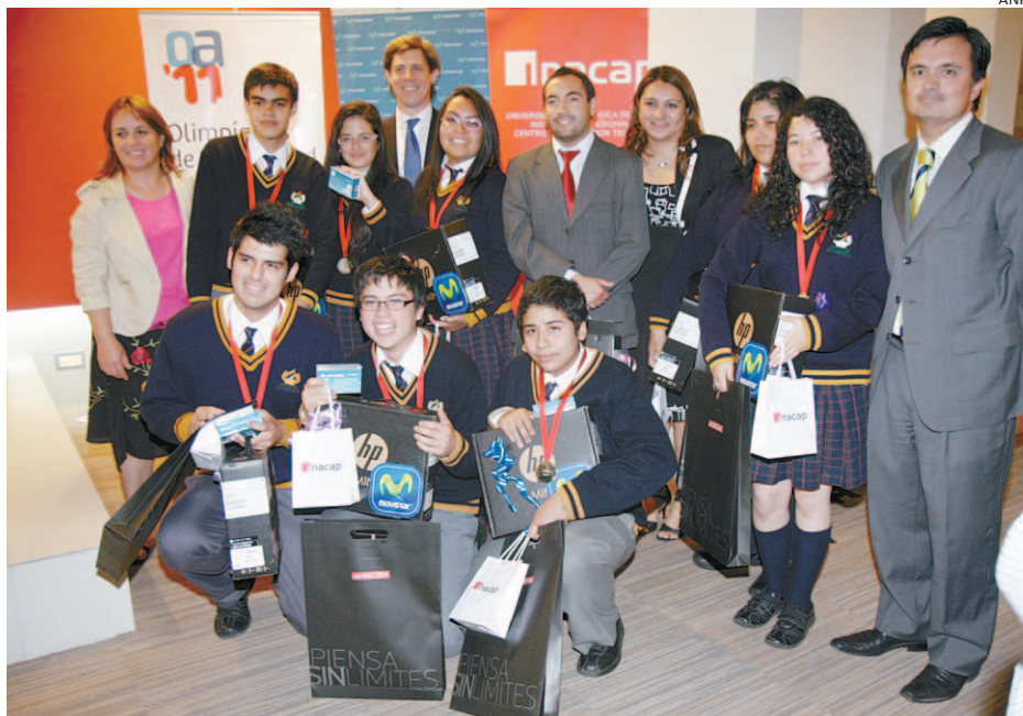
LOS ESTUDIANTES GANADORES DESPUÉS DE TRIUNFAR EN LAS OLIMPIADAS DE ACTUALIDAD.

En base a estos medios, el jurado les hizo preguntas de diversas temáticas como política, economía, espectáculo e inter-