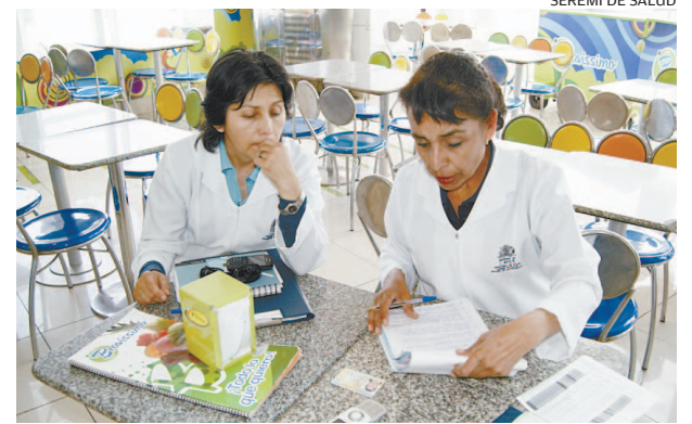
LA SEREMI (S) PASME SELEME EN LA FISCALIZACIÓN A LA HELADERÍA.

El parlamentario independiente propuso avanzar en una reforma tributaria y aseguró no estar preocupado por las consecuencias políticas o electorales que podrían derivarse de su votación.